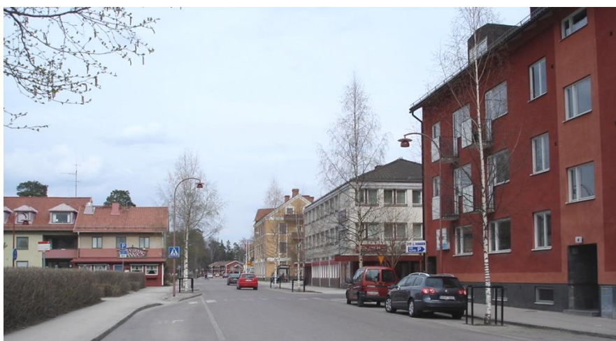
Vasagatans nuvarande utformning fram till Garvaren 13.

Inom centrala Rättvik är kommunen väghållare.