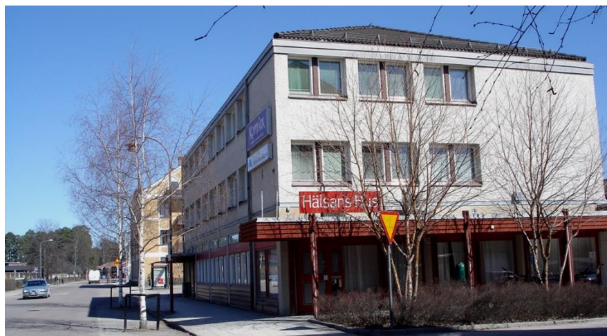
Bebyggelse på Garvaren 11 och 12

Garvaren 11 och 12, söder om planområdet, är bebyggd med en större trevåningsbyggnad som hyser kontors- och verksamhetslokaler. Byggnaden har fasad av betongelement med plåtdetaljer i rött och brunt på nedervåningen. Taket är valmat.