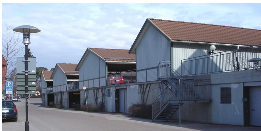
Parkeringsgarage på Garvaren 16.

I planområdets södra del möjliggörs för utökning av befintlig parkering på allmän plats på angränsande fastighet.