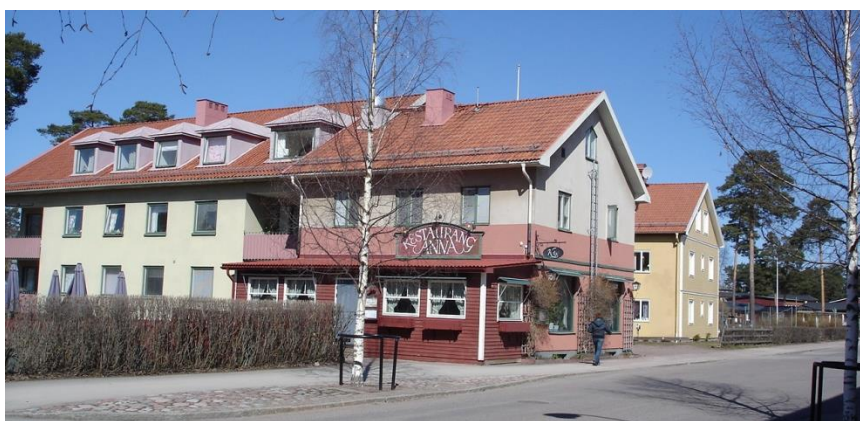
Bebyggelse på Domaren 1

Domaren 1, på Vasagatans norra sida, är bebyggd med två bostadsfastigheter, varav den ena innehåller en restaurangdel ut mot gatan. Båda byggnaderna är uppförda i två våningar med inredd vindsvåning. Den södra byggnad är putsad i gula, röda och beigea färger medan den norra har gulmålad träfasad som delvis är reveterad.