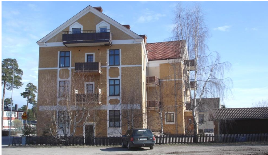
Bebyggelse på Garvaren 14

Garvaren 14, norr om planområdet, är bebyggt med ett bostads- och affärshus från 1915 i tre våningar med inredd vind. Byggnad har putsad fasad i gult med vita fönsterinramningar och ornament. Gårdsbyggnaderna är uppförda i trä.