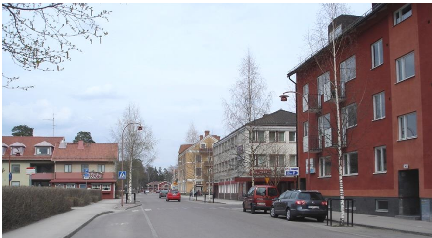
Vasagatans nuvarande utformning fram till Garvaren 13.