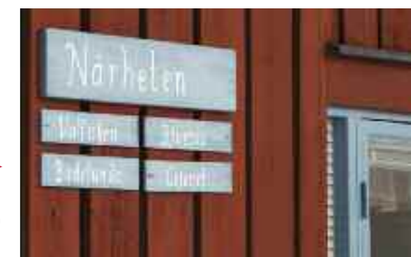
▶ På Närheten bor åtta pojkar i åldern 14 till 18 år. De kommer från Somalia, Afghanistan och Irak.

– Det går inte föreställa sig vilken skillnad det är mellan att leva i Afghanistan och i Sverige, säger Edris. Men många av oss är intresserade av att lära oss svenska seder och den västerländska kulturen men hur ska det gå till om ingen talar med oss och berättar hur det ska vara? Det enda de behöver göra är att säga hej och fråga om vi vill vara med och sparka fotboll. Svårare än så behöver det inte vara.