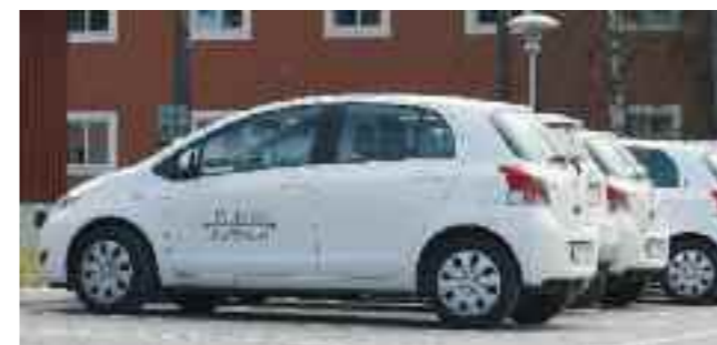
▲ I Rättvik är 25% av befolkningen äldre än 65 år. Många av dem kan bo kvar hemma tack vare utökad satsning på hemtjänst.

KUNSKAPEN om olika hjälpmedel och förflyttningstekniker har ökat inom hemtjänsten och i kombination med bland annat modern teknik, som trygghetslarm, och bra hemsjukvård är det också möjligt för fler att bo kvar i hemmet.